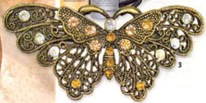
Scarlett Johansson begeistert ein ums andere Mal in beeindruckenden Filmrollen und ebenso mit ihren divenhaften Auftritten wie hier auf dem roten Teppich in Venedig. Scarlett kam zu spät, strahlte aber umso mehr mit weich gewelltem Haar und Schmetterlingschmuck